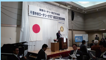
千葉中央ロータリークラブ第 2000 回記念例会