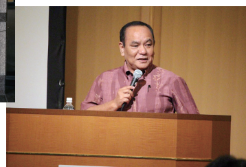
基調講演：「懸命に生きる人々」池間哲郎氏