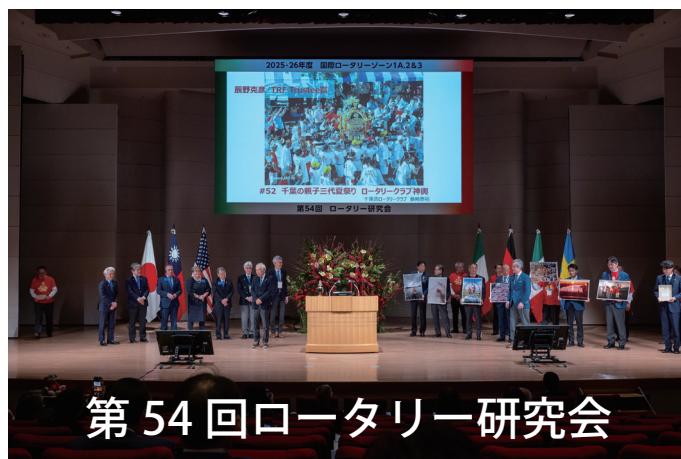
第54回ロータリー研究会